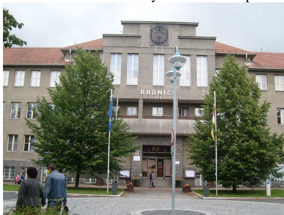
Sídlo Městského úřadu v Litvínově

Z požárního hlediska převažují méně rizikové konstrukce. Klasická městská zástavba z počátku století, převažují vícepodlažní činžovní domy využívané k administrativním a obchodním účelům. Jedná se o zděné budovy (kombinace cihel a kamene), sedlové střechy s dřevěnými krovy, střešní krytina z plechových šablon nebo tašek. Některé objekty v současné době slouží k výuce a byly přebudovány z původních továrních objektů dříve určených k textilní výrobě. Přejezd k jednotlivým objektům navazuje na hlavní městskou komunikaci s možností rychlého dosahu požárních jednotek.