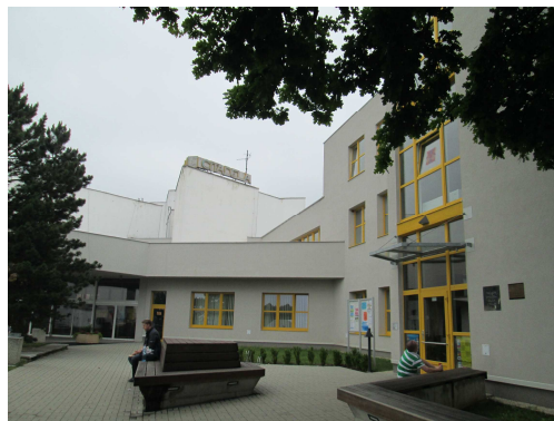
Kulturní dům Citadela

V malém množství se zde nacházejí budovy základních a mateřských škol a další nebytové prostory.