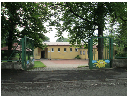
MŠ Bezručova 1712

V malém množství se zde nacházejí budovy základních a mateřských škol a další nebytové prostory.