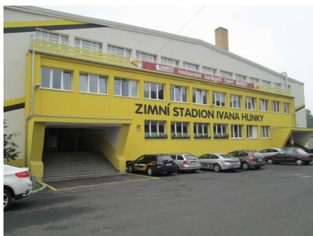
Zimní stadion – hlavní vchod

Největším komplexem Horního Litvínova je zimní stadion I. Hlinky v ul. S.K. Neumanna. Vlastníkem objektu se stalo město Litvínov v roce 2004. V průběhu let proběhla na ZS řada rekonstrukcí.