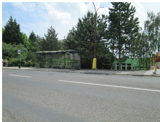
Zastávka Janov - Přátelství