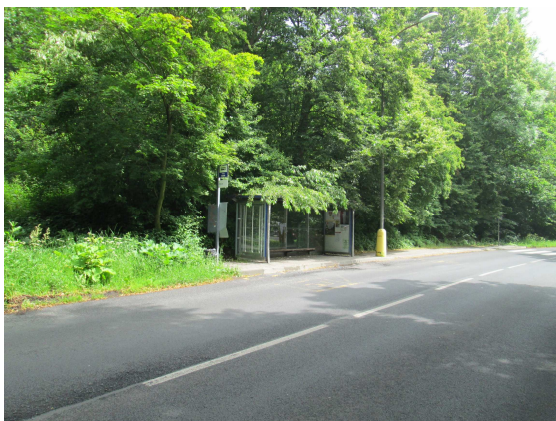
Zastávka Podkrušnohorská Koldům

V současné době vlastní město Litvínov asi 70 autobusových zastávek, které jsou také předmětem pojištění. Téměř všechny jsou prosklené.