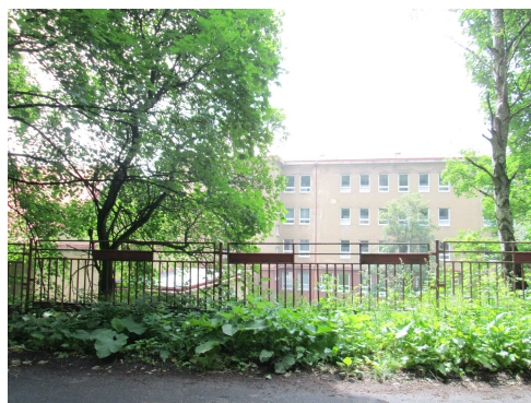
ZŠ Podkrušnohorská 1677